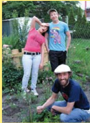
Gartengestaltung in der „Arni 3“

Im diesjährigen Frühjahr erfuhr der Garten unserer sozialtherapeutischen WG endlich eine Generalüberholung und strahlt nun im neuen Glanz. Ein nigelnagelneuer Holzzaun und vielfältige Anpflanzungen machten aus der sich selbst überlassenen Parzelle wieder eine Augenweide.