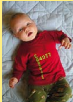
Die passende Geschenkidee für große und kleine Connewitzer

Aufgrund der großen Nachfrage: Die äußerst begehrten Connewitz-T-shirts von suedpol gibt es nun ab der Kindergröße 74, als Lady-fit und bis hin zur XL. Und auch der Löbniger sowie die Löbnigerin finden das passende Shirt. Zu erwerben im suedpol-Laden, Bornaische Straße 49.