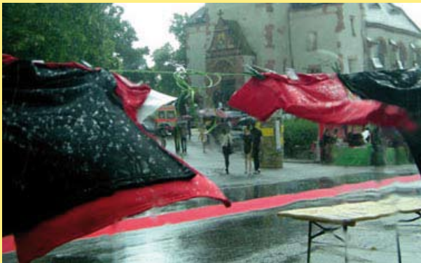
Ein echter Hingucker: Der rote Teppich des Connewitzer Strassenfestes

Nur noch wenige rennen durch den Regen. Auf der Leine erhalten die neuen Connewitz T-shirts des suedpol an unserem Stand einen ersten Waschgang.