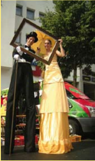
Sehr „großer“ Andrang vorm suedpol-Stand

Punkt 15:00 Uhr flüchtet alles unter die Bäume. Tropischer Regen entlädt sich über dem Connewitzer Strassenfest. Und so wird der Blick auf den langen roten Teppich der sich über die gesamte Selnecker Straße schlängelt erstmals wieder frei.